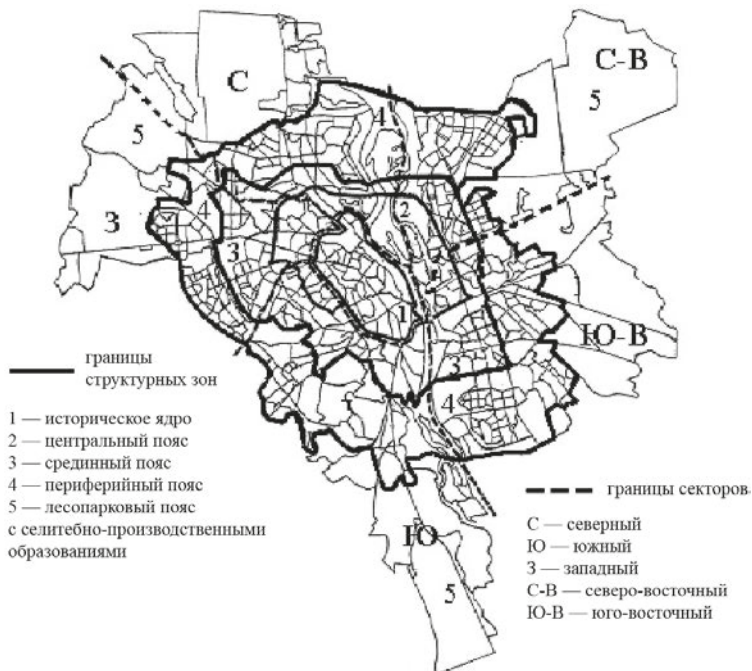
Рис. 2. Поясно-секторная структура Киева