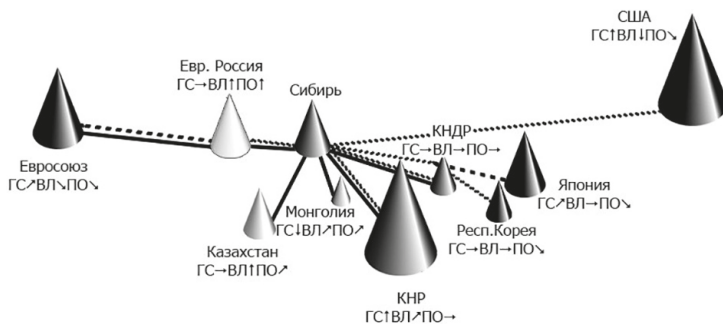
Рис. 3. Абстрактная модель геополитического положения для Сибири

ГС — геополитическая сила субъекта, ВЛ — влияние на рассматриваемый субъект (Сибирь), ПО — политическое отношение между субъектами; ↑ — высокий уровень показателя, ↗ — повышенный, → — средний, ↘ — пониженный, ↓ — низкий