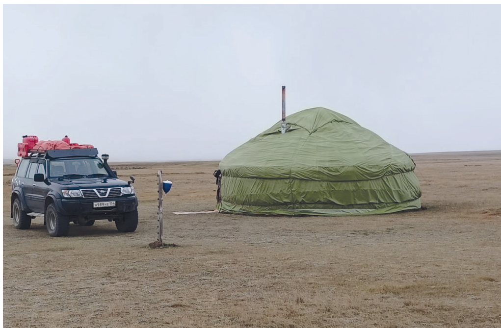
Приложение 4.7. Юрта для размещения туристов (плоскогорье Укок, август 2022)