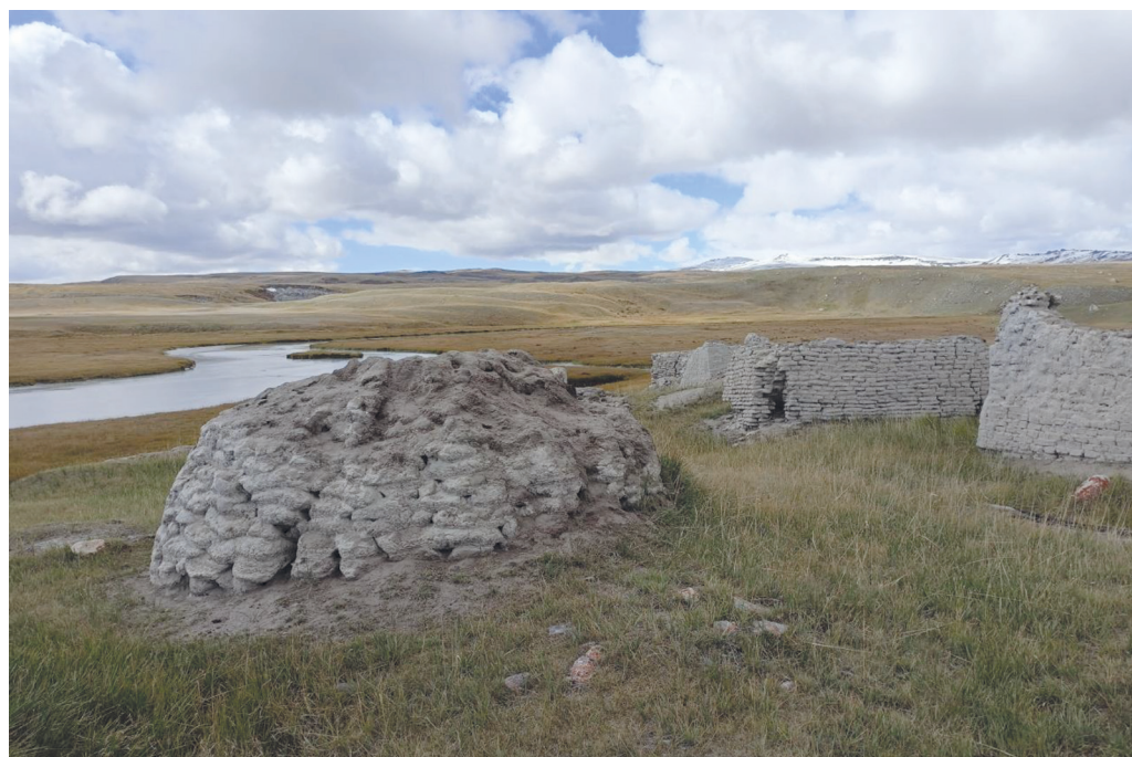
Приложение 4.9. Зброшенне казахское кладбище в долине р. Калгуты (плоскогорье Укок, август 2022)