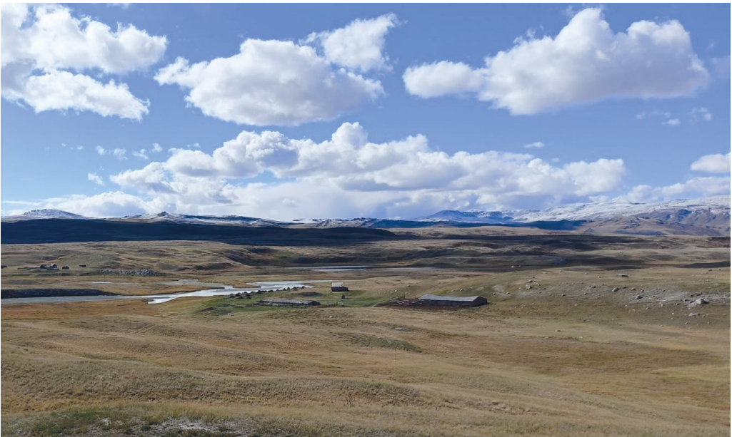
Приложение 4.3. Животноводческая стоянка (зимник) в долине реки Ак-Алаха (плоскогорье Укок, август 2022)