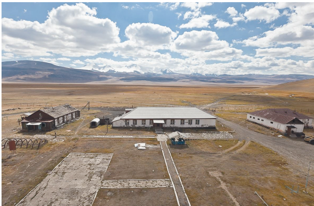
Приложение 4.5. Зброшенна погранична застава Аргамджи (плоскогорье Уюк, июль 2023, съемка с квадрокоптера)