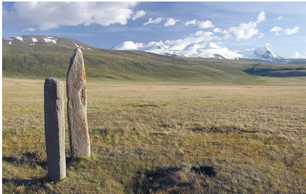
Приложение 4.8. Оленные камни — сакральный объект теленгитов (плоскогорье Укок, август 2022)