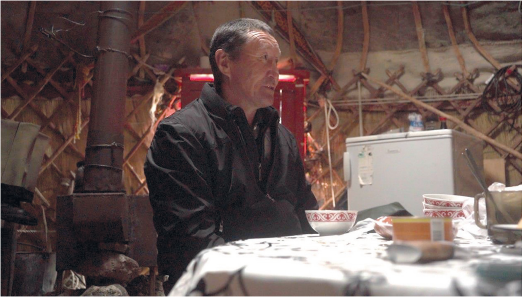
Приложение 4.2б. Местный животновод во время интервью (плоскогорье Укок, август 2022)