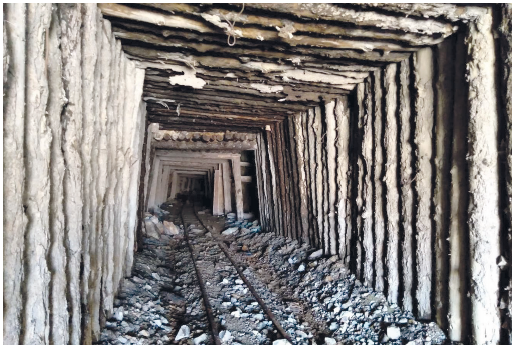
Приложение 4.6. Заброшенный промышленный культурный ландшафт (Штольня Калгутинского рудника) (плоскогорье Укок, июль 2023)