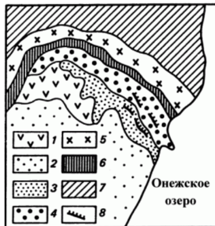
Рис. 4. Обобщенная схема геологического строения участка Шокшинского месторождения

Изготовление самого саркофага превратилось в серьезную техническую проблему [11], так как размер блоков и необычайная твердость камня превосходили все, когда-либо сделанное со времен Древнего Египта. Расчеты убедительно показали, что обработка монолитов и их подгонка друг к дру-