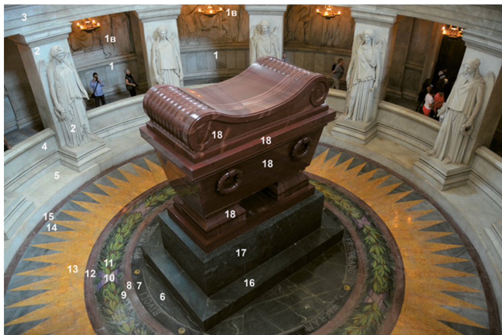
Рис. 1. Цветной камень в гробнице Наполеона и крипте

Гробница Наполеона в Доме Инвалидов в Париже создавалась в течение 20 лет, с 1841 по 1861 г. по проекту Луи Висконти [2–4]. Саркофаг выполнен из русского камня. Его называют то гранитом, то порфиром, но фактически это кварцит. Висконти устроил под куполом в центре собора крипту диаметром 15 м и глубиной более 10 м. Мощные мраморные плиты сплошь покрывают вертикальную стену, а по кругу идут две галереи. Верхнюю из них поддерживают двенадцать мраморных опор со статуями, посвященными победам Наполеона. Каждая опора и скульптура на ней иссечена в едином монолите Жаном-Жаком Прадье.