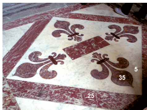
Рис. 7. Примеры флорентийской мозаики в полу Дома Инвалидов 5, 25, 27, 35, 40 — цветные мраморы.

В 2008 г. мраморная флорентийская мозаика полов Дома Инвалидов была полностью реставрирована (рис. 7). Прежняя была создана еще в 1761 г.