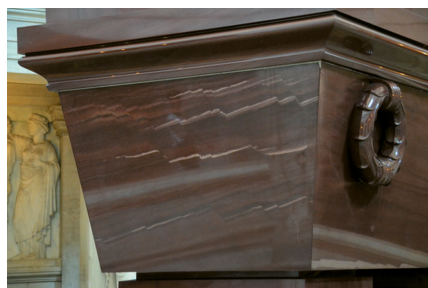
Рис. 5. Слоистость и система мелких дислокаций в кварците в стенке саркофага.

1 — диабазы; шокшинская свита; 2 — красные песчаники; 3 — малиновые кварциты; 4 — красные кварциты; 5 — розовые кварциты; 6 — хлорито-серецитовые сланцы; 7 — серые песчаники; 8 — карьеры