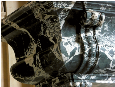
Рис. 2. Цветной камень в гробнице Дюрока

Другой цветной камень, важный по видению Висконти для общей колористики